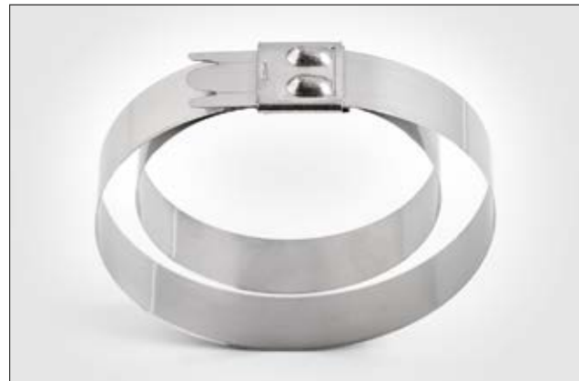
Edelstahlkabelbinder für Doppelbündelung, unbeschichtet, MBT_UHD.